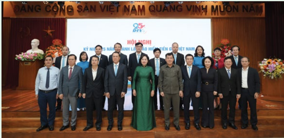
Thống đốc NHNN Nguyễn Thị Hồng, lãnh đạo NHNN, lãnh đạo Đảng ủy khối DNTW và lãnh đạo các Bộ, ban ngành chụp ảnh lưu niệm với Ban lãnh đạo BHTGVN