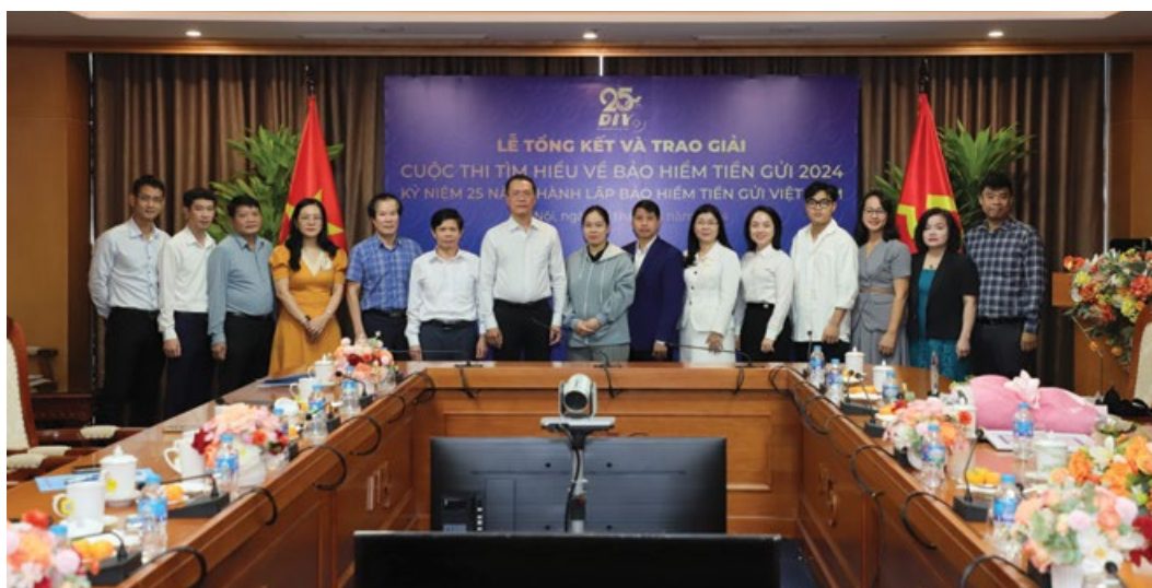
Lãnh đạo BHTGVN và các cá nhân, đơn vị được trao giải

Hướng tới kỷ niệm 25 năm thành lập Bảo hiểm tiền gửi Việt Nam (09/11/1999 – 09/11/2024), Bảo hiểm tiền gửi Việt Nam đã tổ chức cuộc thi “Tìm hiểu về bảo hiểm tiền gửi 2024” nhằm tuyên truyền, lan tỏa chính sách bảo hiểm tiền gửi (BHTG) đến công chúng và quảng bá hình ảnh, hoạt động của Bảo hiểm tiền gửi Việt Nam (BHTGVN) tới toàn xã hội, từ đó nâng cao hiểu biết của công chúng về chính sách BHTG.