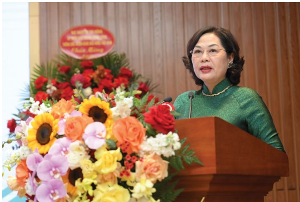
Thống đốc Nguyễn Thị Hồng – Ủy viên Trung ương Đảng, Bí thư Ban Cán sự Đảng, phát biểu tại Hội nghị Kỷ niệm 25 năm thành lập BHTGVN

(Trích đăng phát biểu của Thống đốc Nguyễn Thị Hồng tại Hội nghị Kỷ niệm 25 năm thành lập BHTGVN)