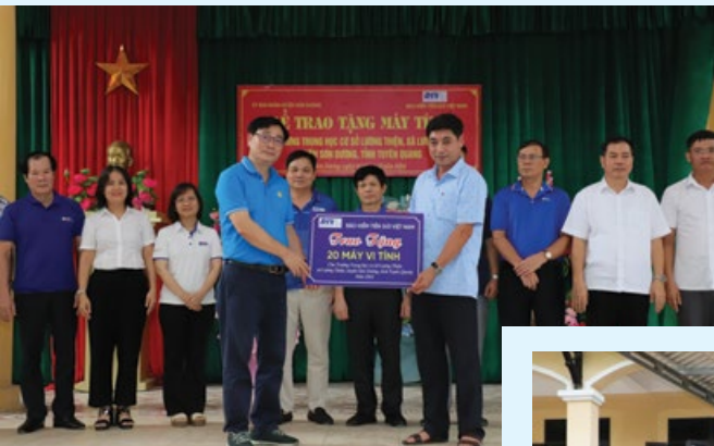
Trong chuỗi hoạt động kỷ niệm 25 năm thành lập, Công đoàn BHTGVN đã tổ chức hoạt động an sinh xã hội, thực hiện trao tặng 20 máy tính cùng các phần quà cho Trường Trung học cơ sở Lương Thiện, huyện Sơn Dương, tỉnh Tuyên Quang.