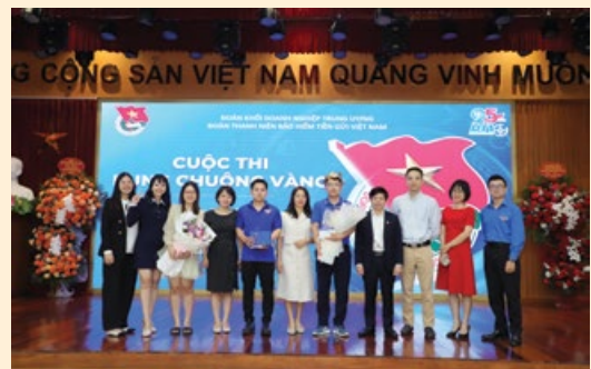
Các thí sinh xuất sắc nhất của cuộc thi Rung chuông vàng và các vận động viên tham dự