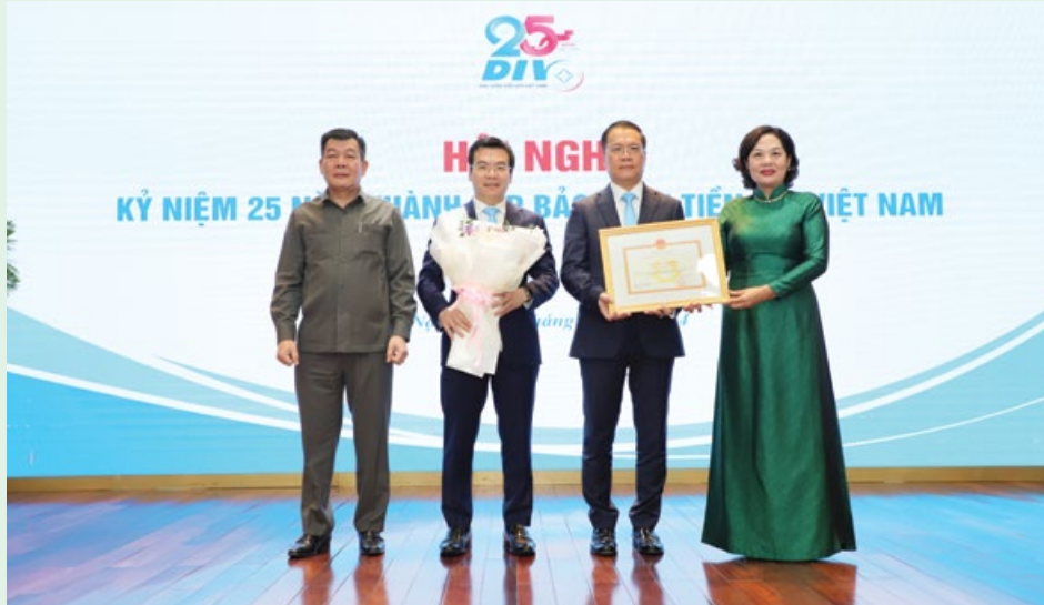
Thống đốc NHNN Nguyễn Thị Hồng và Phó Bí thư Thường trực Đảng ủy Khối Doanh nghiệp Trung ương Nguyễn Đức Phong trao tặng Bằng khen và hoa chúc mừng BHTGVN.