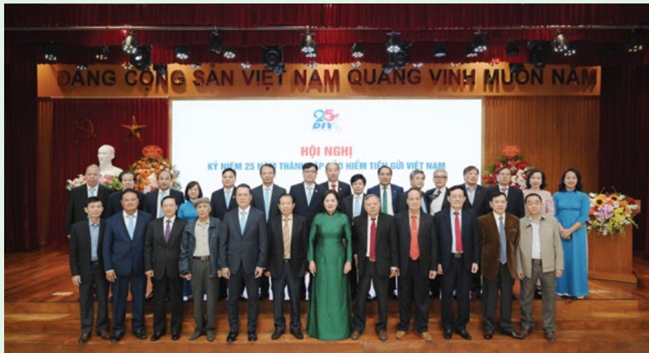
Thống đốc NHNN Nguyễn Thị Hồng, lãnh đạo NHNN, lãnh đạo Đảng ủy khối DNTW chụp ảnh lưu niệm với các thế hệ lãnh đạo BHTGVN